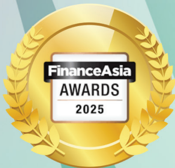
Most DEI Progressive

Komitmen Bank Mandiri dalam mewujudkan tempat kerja yang adil, inklusif, dan beragam telah mendapatkan pengakuan di tingkat regional :