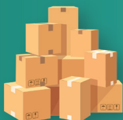
Bahan Pokok Posko

Melalui berbagai program tanggap bencana, Bank Mandiri akan terus berupaya hadir di tengah masyarakat, tidak hanya sebagai institusi keuangan, tetapi juga sebagai mitra yang peduli dan siap mendampingi dalam setiap kondisi.