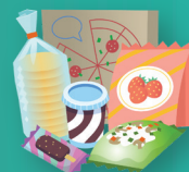
Snack Ringan untuk anak