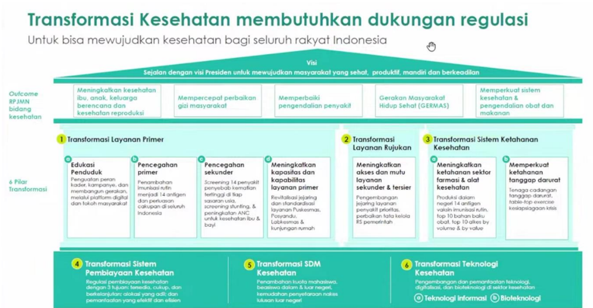
Grafik 1. Enam Pilar Transformasi Kesehatan